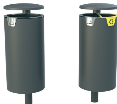
Corbeille Rivage 60L